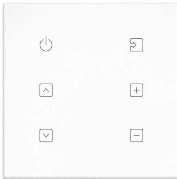
OT - FM2A